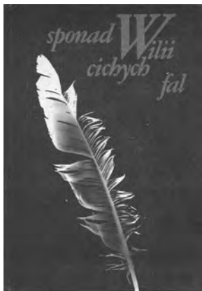
Okładka zbioru wierszy Sponad Wilii cichych fal

W 1985 roku ukazała się w Kownie pierwsza na Litwie po II wojnie światowej polska książka poetycka Sponad Wilii cichych fal . Nakład wyniósł 600 egz., a edytorem było wydawnictwo Šviesa zajmujące się zwykle drukiem podręczników (również dla szkół z polskim językiem wykładowym) i innych publikacji oświatowych 1 . To było ważne wydarzenie w życiu kulturalnym, szczególnie literackim, Polaków na Wileńszczyźnie. Rzec można, iż w podobny sposób sprawa tyczyła krajowego życia literackiego, niestety wówczas w Polsce mało kto tę pozycję zauważył i omówił. Zresztą podobnie działo się przez następnych kilkadziesiąt lat! 2 Dziś tamta edycja to właściwie zapomniany fakt, coraz mniej jest bowiem świadków czasu. Istotny udział w zdarzeniu miał zielonogórski literat Henryk Szyłkin (1928-2022). Jednak – co może dziwić – mimo jego aktywności na rzecz wydania kowieńskiego zbioru poezji i znaczącego udziału w opracowaniu redakcyjnym oraz mimo wcześniejszych działań na rzecz środowiska literackiego „polskiego Wilna”, H. Szyłkin został pominięty na stronach Sponad Wilii jako redaktor dziełka. Dlaczego? Warto wrócić do tej sprawy.