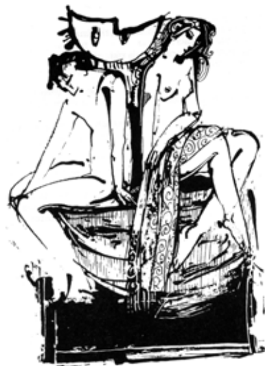
rys. M. Ćwiertnia