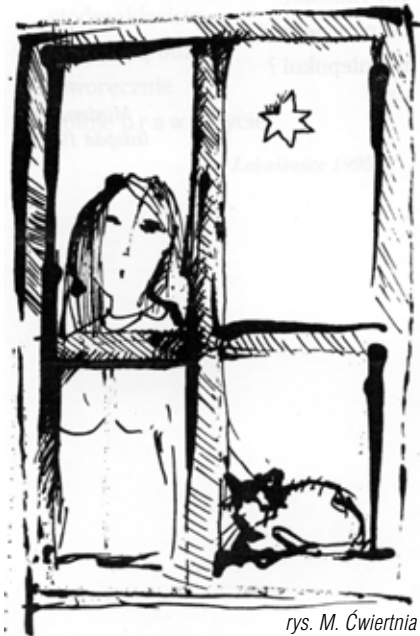
rys. M. Ówiertnia