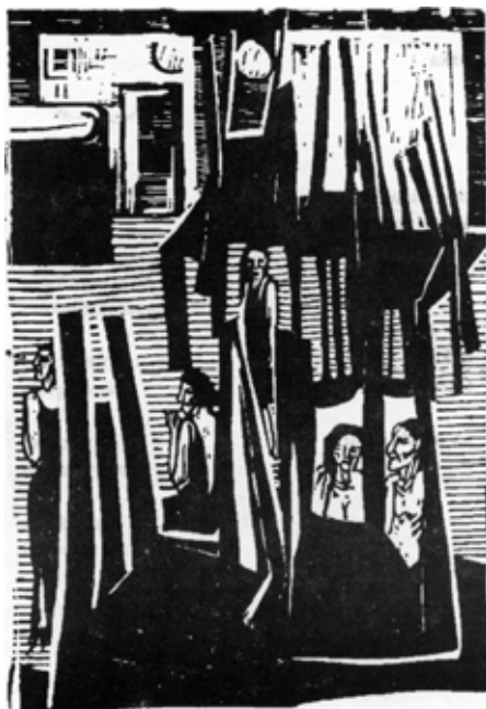
rys. M. Ćwiertnia

Teraz kiedy płacę Za Ciebie i za siebie Kiedy się spowiadam Raz w roku Zwykłym Pitem Kiedy odprowadzam Podatek naliczany Od głupoty władzy Pociesz mnie nowelizacją Zasad dekalogu Odpuszczeniem akcyzy Komputerowym wirusem Jakaś drobną prawdą Przyznaj że nie oni Tylko my jesteśmy Zwykli terroryści I nie odpuszczaj niczego O co Cię proszę