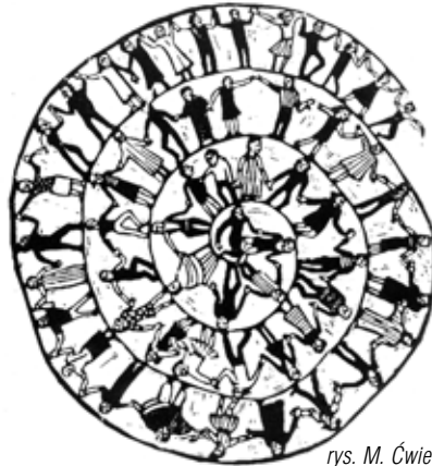
rys. M. Cwiertnia

lada dzień brawura spadających liści zauroczy nas