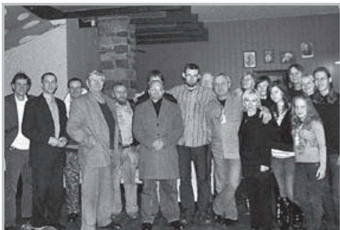
Na koniec wspólne zdjęcie

Na pytanie – po co był ten festiwal? co ci przyniósł? – festiwalowcy odpowiadali, że wiele się nauczyli, że w inny sposób spojrzeli na swoją twórczość, że poczuli się wyróżnieni i potraktowani bardzo serio, bo pisanie to poważna sprawa. W gronie sobie podobnych czas spędzało się wyjątkowo dobrze. Niektórzy z góry zapisali się na przyszłoroczny festiwal – a odbędzie się on w ostatni weekend sierpnia 2010 roku. Zapraszamy.